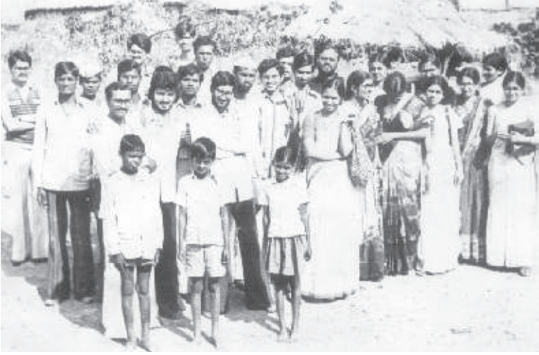
१९८० हॅलो चळवळीची पहिली बॅच